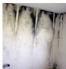
Schimmelpilze hinter einer isolierten Wandverkleidung.

Die kostenpflichtige Nummer 0900 105 848 führt zum von Fachleuten betreuten Beratungstelefon, das jeweils Montag, Dienstag, Donnerstag und Freitag, von 9–12 Uhr, sowie mittwochs von 14–17 Uhr bedient wird. Die Kosten betragen Fr. 2.50/Min.