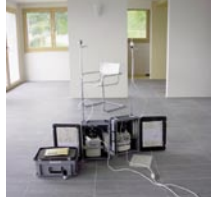
Kontrollmessung der Luft auf VOC in einem neuen, konsequent nach baubiologischen Prinzipien gebauten, MCS-gerechten Haus.