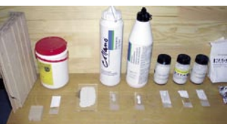
Die einzelnen Baustoffe werden auf Glasplättchen aufgetragen und auf Verträglichkeit am Patienten getestet.